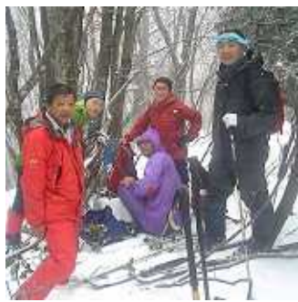
ハチマキがワタシです

山仲間と東城山(611m)に行ってきました。東城山は片貝の東城の裏山です。東城から林道を伝って黒谷へ抜けてきました。手軽な雪山ジョギングで、心身リフレッシュできました。