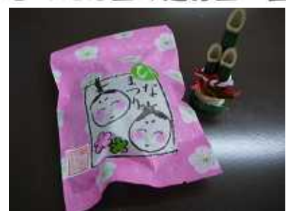
中は生クリームの入った ドラヤキです。