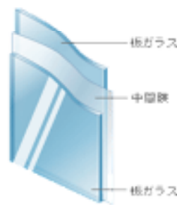
合わせガラスのイメージです

※ガラスの施工方法などの諸条件によって性能に差が出ますので、詳細はお気軽にお問い合わせください！